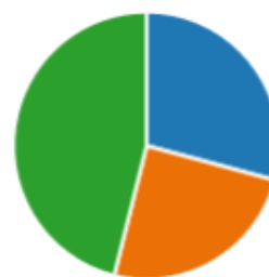
Imaginea 4.Reprezentarea grafică în opțiunea de alegere a facultăți „Vasile Alecsandri” din Bacău.