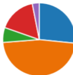
Imaginea nr 1. Reprezentare grafică cu privire la utilitatea informațiilor primite în cadrul evenimentului.

Itemul 2 - întrebare cu răspunsuri multiple care evidențiază modalitatea de aflare a informațiilor despre oferta educațională a Universității „Vasile Alecsandri” din Bacău: